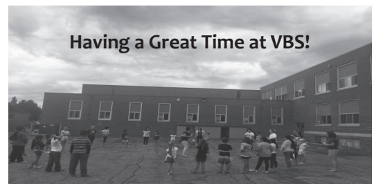
Having a Great Time at VBS!

Un agradecimiento especial para todos los catequistas y voluntarios que ayudaron dando su servicio y tiempo en la escuela de Biblia de la semana pasada ya que fue una semana muy grandiosa gracias a todos ustedes, también a todas las personas que nos donaron los ricos bocadillos. Muchas gracias Dios les bendiga.