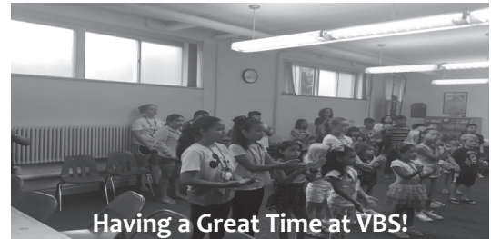
Having a Great Time at VBS!

A Special Thank You to all the catechists and volunteers who gave so generously of their time for our Vacation Bible School last week! We could not have had such a great time without all the effort from our volunteers. A HUGE thank you to all who helped plan, helped with the children every day, and those who brought delicious snacks. Bless your hearts!